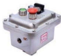
EXM Línea modular para comando, señalización, conmutación y accionamientos TM. 4 tamaños de cajas para contener hasta 6 funciones.