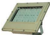
EPRL Proyector LED Zona 2 de 300 Watt. IP 66