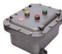
EXCO Caja para contactores tripolares de 3Kw-7A hasta 45Kw-95A.