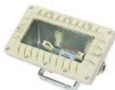
EXPC Proyector APE para lámparas de cuarzo yodo hasta 300W