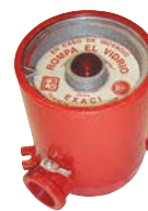
EXACI Avisador contra incendio, con disposición de vías E, C y L, con roscas de 1/2" y 3/4" NPT.