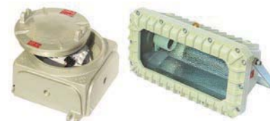
EXPMH + EXPEV Proyector y caja porta equipo para lámparas tubulares de vapor Hg, vapor Na y vapor de Hg halogenado hasta 400W.