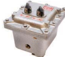
EXAD Caja para interruptor termomagnético, unipolar, bipolar o tripolar con 2 accesos a 180° de 3/4" NPT.