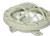
EXATR Artefacto aplique de iluminación para lámparas incan- descentes hasta 100 W o bajo consumo. Opción LED.