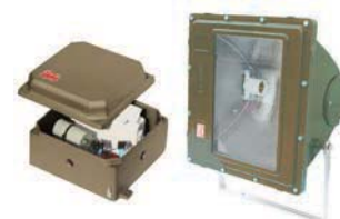
EDAPR + EDPEV Proyector y caja porta equipo para atmosferas de polvos combustibles Ex DIP A 21 para lámparas tubulares o elípticas de vapor de Na y vapor Hg halogenado hasta 400W.