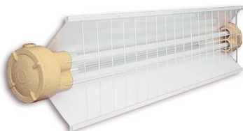
XAFR Artefacto fluorescente de 1 o 2 tubos de 20/40/65 y 105W. Opcional con equipo de emergencia hasta 40W.