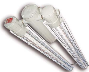
EXAFR Artefacto fluorescente de 2 tubos 18/36/58 W. Opcional con equipo de emergencia en 36 W. Opción LED 2 x 23 Watt.