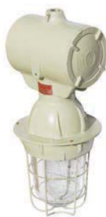
EXAIM / S / H Artefacto de iluminación para lámparas de vapor Hg hasta 400W, vapor Na hasta 250W y vapor Hg halogenado hasta 400W.