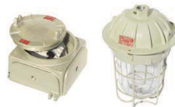
EXAI + EXPEM / H / S Artefacto de iluminación con equipo a distancia para lámparas de vapor Hg, vapor Na y vapor Hg halogenado hasta 400W.