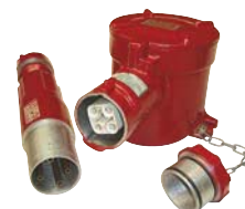
EXTC / EXF Tomacorriente y ficha de 220V-16A (2P+T) y 380V-32A (3P+T).