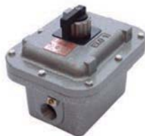
EXM + EXMCAIN Caja con interruptor hasta 3 polos 3 posiciones