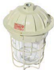
EXAI Artefacto de iluminación para lámparas hasta 400 W.