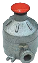
EXBPE / EXBPE CR Botonera para parada de emergencia con o sin retención, con disposición de vías E, C, L, T y X con roscas de 1/2" y 3/4" NPT.