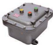
EXAET Caja para arrancador estrella triángulo de 5,5 Kw-12A hasta 75Kw-150A.