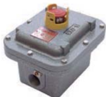
EXM + EXM PR CA Caja golpe de puño con protección contra contacto accidental.