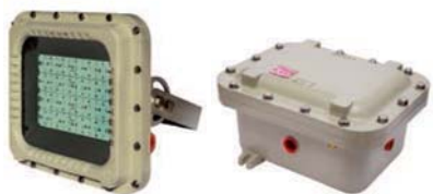
EXPRL + EXPEL Proyector LED Zona 1, 2, 21 y 22 IP 66 Exd IIB + H2 T6