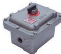
EXICF Caja para seccionador con comando frontal de 32A hasta 63A.