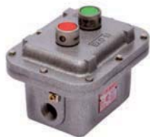
EXC 2B Botonera APE con 2 pulsadores y 2 accesos a 180° de 3/4" NPT.