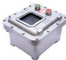
EXCA / EXCA B Caja para instrumento de medición y control.